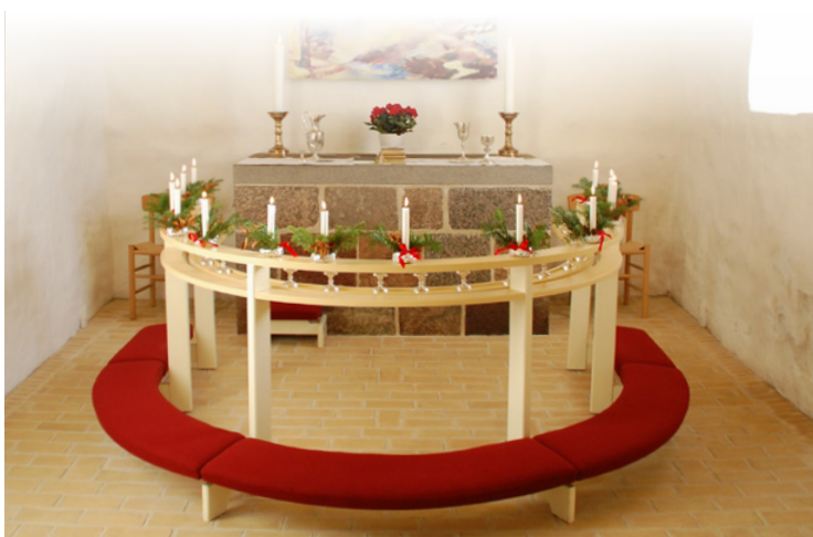
Forsidefoto: 2. søndag i advent 2017, Ravnkilde præstegård.

Pga. den øgede opmærksomhed på beskyttelse af personfølsomme data har jeg valgt at undlade fødselsdato under Siden Sidst - HL